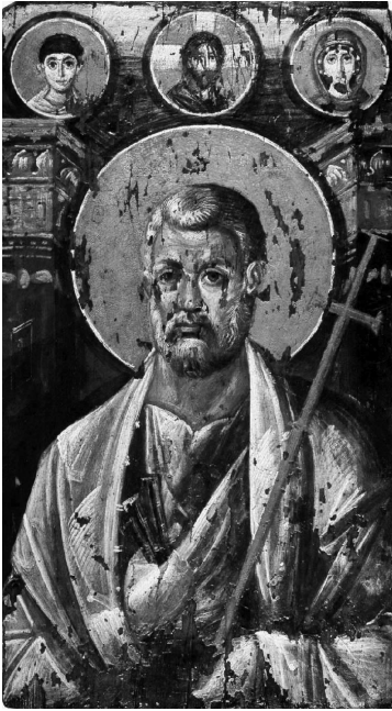
წმ. პეტრე, წმ. ეკატერინეს მონასტერი (სინას მთა, VI ს.)

პირველი სამი საუკუნის რომის ეპისკოპოსებზე ჩვენ ცოტა რამ ვიცით. ვიცით მხოლოდ სახელები, რომლებიც პაპის კათალოგებშია შემონახული. რომის პაპთა მოღვაწეობის ამსახველი კრებულთა Liber Pontificalis (ყველაზე ადრეული ვერსია – Catalogus Felicianus – VI-VII საუკუნეებით თარიღდება) მოგვიანებით შეიქმნა.