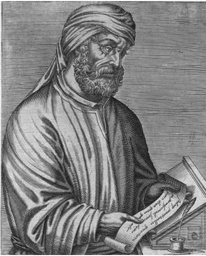
ტერტილიანე (155/165-220/240, ახალი დროის გრავიურა)

II-III საუკუნეებში, როდესაც თავად ქრისტიანული მოძღვრების წიაღში მიმდინარეობდა ე.წ. ქრისტოლოგიური დავები, საეკლესიო ავტორიტეტის საკითხი განსაკუთრებით აქტუალური ხდება. ამავე პერიოდში ღვთისმეტყველები ტერტილიანე (155/165-220/240), ირინეოსი (დაახლ. 130-202) და კიპრიანე კართაგენელი (გარდ. 258) ხაზს უსვამენ რომის კათედრის, როგორც „სამოციქულო ტახტის“, განსაკუთრებულ მნიშვნელობასა და ავტორიტეტს. რომის ეპისკოპოსმა მარცელინემ (296-304) პირველად შემატა რომის ეპისკოპოსებს „პაპის“ ტიტული (ბერძნულად papas მამას ნიშნავს), რომელიც მან აღმოსავლეთიდან ისესხა, სწორედ ასე ეძახდნენ ეპისკოპოსებს აღმოსავლეთში.